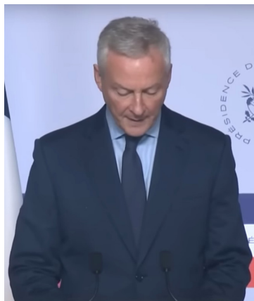
Bruno Le Maire, transfuge des républicains et macroniste zélé, était chargé de faire le SAV gouvernemental.

Plus 6,7 milliards d'euros (sur 30 milliards en 2021) pour atteindre le plein-emploi. Mais ce coup de pouce sert d'abord à réparer les bêtises du premier quinquennat. Pour atteindre le million de contrats d'apprentis, il faut remettre à flot France compétences, l'organisme financeur qui a bu la tasse (- 3,2 milliards en 2021), sous l'effet