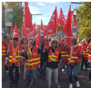
250 000 manifestants ont défilé dans toute la France.

L'exigence d'une augmentation des salaires et des retraites s'est faite bruyamment entendre. «Je n'arrive plus à boucler les fins de mois», raconte cette jeune mère de famille croisée au détour de