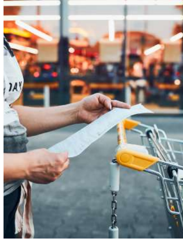
Les prix dans les supermarchés devraient bondir de «plus de 14%» en 2023.

L'Insee annonce ce vendredi 14 avril +5,7% de hausse des prix sur un an. Cette flambée devrait se poursuivre en 2023 (+6,5%), particulièrement sur les produits alimentaires (+14%). Un secteur où les entreprises affichent des profits records et freinent les hausses de salaires.